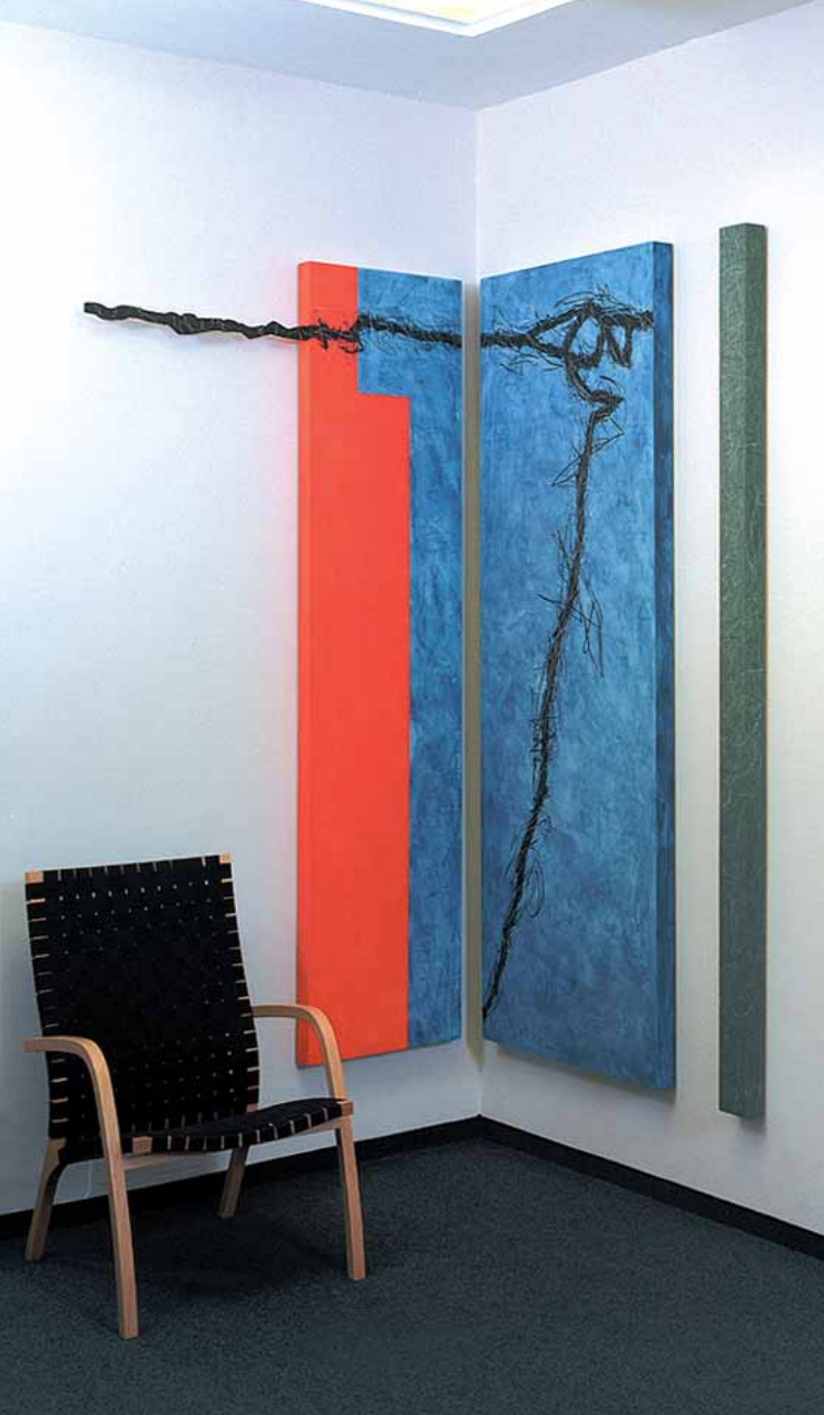
Steuerkanzlei Boymanns | Viersen Raumarbeit | Öl auf Multiplex H 220 cm | B 130 cm | T 50 cm