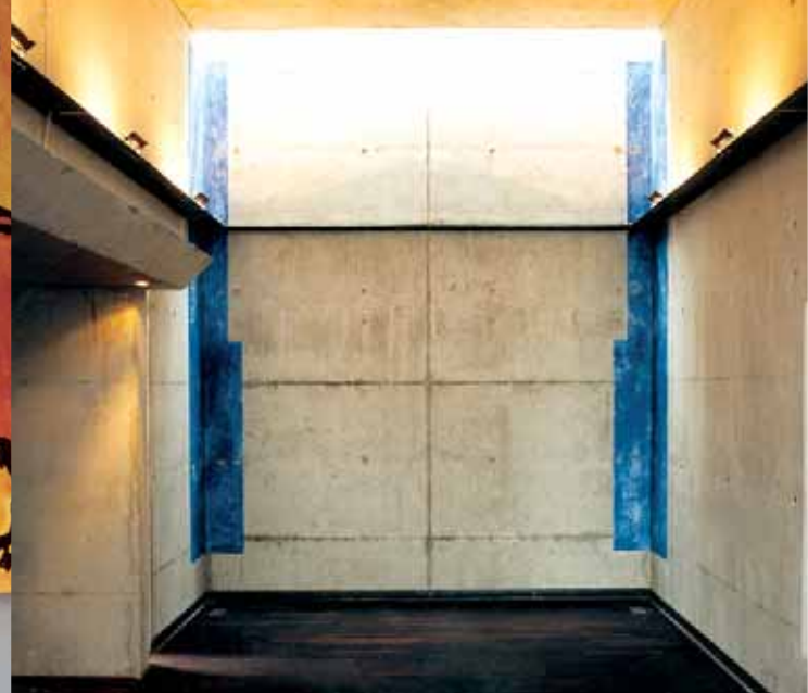
Pfarrzentrum St. Maria Magdalena | Geldern Meditationsraum | Öl auf Beton