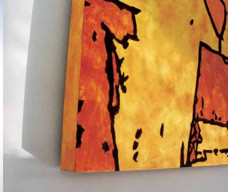
Wandarbeit in einem privaten Schwimmbad | Geldern Öl auf Multiplex 90 x 400 cm