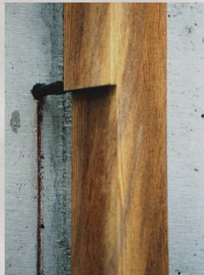
< Kreuz | Details >