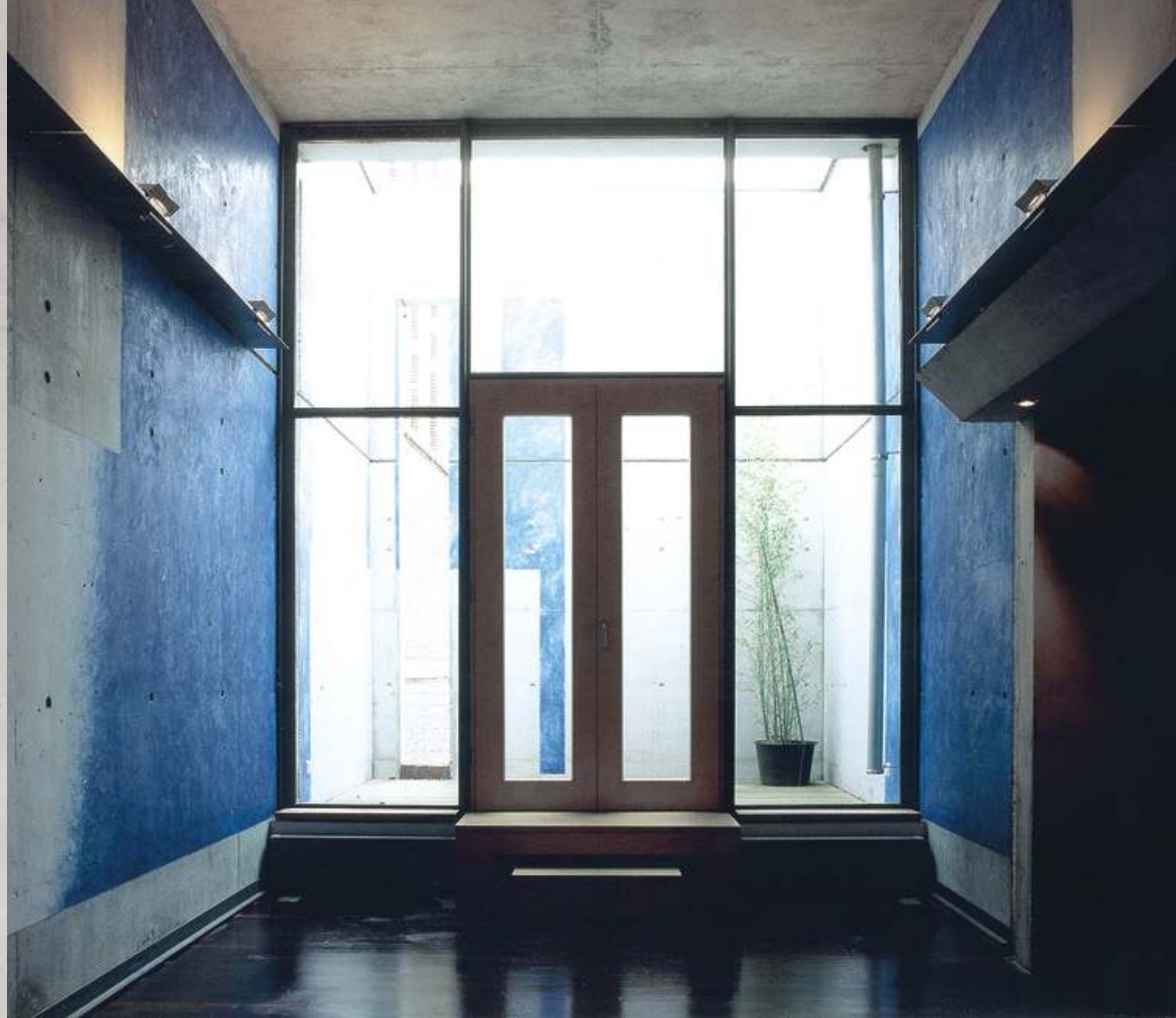
Ansicht Giebelwand zum Meditationshof + Zugang