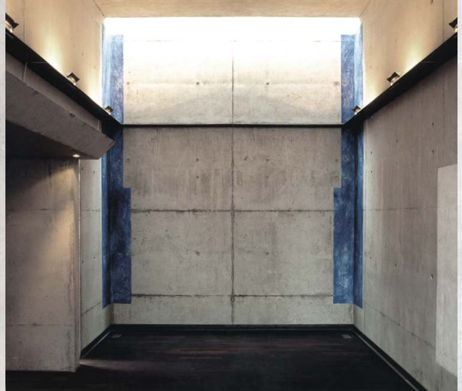
Ansicht Giebelwand im Meditationsraum